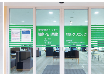
クリニックの入り口