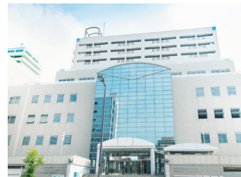
都島センタービル外観