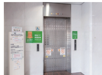
入って左手のエレベーターで地下3階まで降りてください。