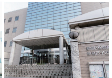
正面玄関の階段を上がります。