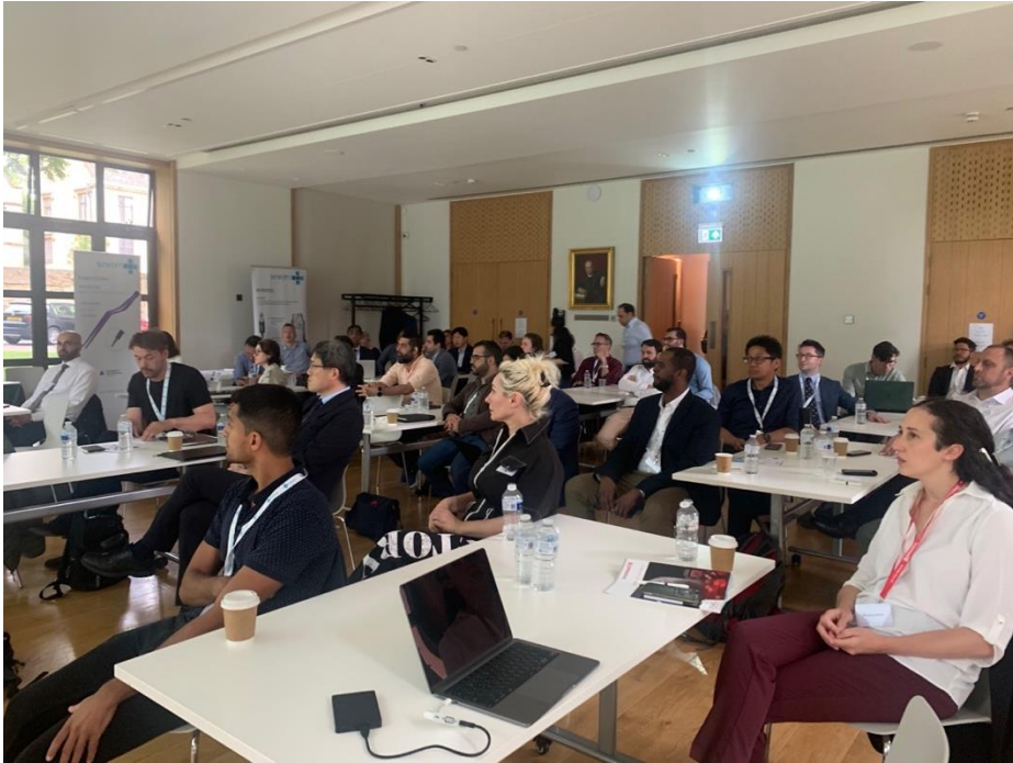
講習会の会場内の様子.